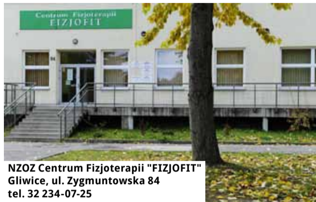
NZOZ Centrum Fizjoterapii "FIZJOFIT" Gliwice, ul. Zygmuntowska 84 tel. 32 234-07-25

Co trzecia kobieta i co dziesiąty mężczyzna są narażeni na kłopotliwe intymne dolegliwości. Możesz temu zapobiec a także poddać się bezpiecznemu i skutecznemu leczeniu.