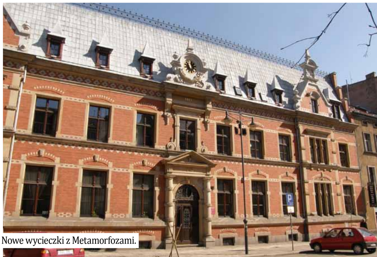
Nowe wycieczki z Metamorfozami.

Niewątpliwie do najważniejszych realizacji należy zaliczyć gliwicką synagogę, której współautorem był Louis Tropolwitz. Powstała w latach 1859–1861 przy Wilhelmsplatz (obecnie Plac Inwalidów) – spalona została w 1938 roku. Synagoga zaliczała się do największych i najpiękniejszych obiektów w tej części miasta. Po rozbudowie na początku XX w. stała się jedną z największych na Górnym Śląsku. Wewnątrz posiadała podwójne balkony, co upodabniało jej wnętrze do kościołów ewangelickich.