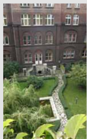
Budynek Zarządu O/S Eisenindustrie – obecnie siedziba „Biprotu” przy ulicy Dubois (budynek został nadbudowany i w znacznym stopniu zmieniony).