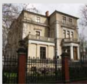
Budynek Starostwa Powiatowego – istniejący do dziś budynek przy ul. Zygmunta Starego (d. Teuchterstr.) – jego projektantem był Carl Hieronymus, a został zbudowany przed 1879 rokiem.

Lubowski zaczął również aktywnie uczestniczyć w pracach Rady Miejskiej. Podlegały mu m.in. sprawy miejskiego wodociągu, należał do komisji kontroli budżetowej, był jednym z radnych decydujących o zatrudnieniu miejskiego budowniczego. Był również jednym z założycieli Towarzystwa Pożyczkowego. W 1885 roku otrzymał dyplom pamiątkowy z wize-