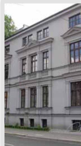
Willa Maxa Perlsa przy ul. Zygmunta Starego – elewacja od strony ulicy została w dużym stopniu zachowana.

Pozostałe dzieci, oprócz zmarłego w dzieciństwie jednego z bliźniaków, osiągnęły wysoką pozycję społeczną. W 1888 roku zdrowie Salomona Lubowskiego znacznie się pogorszyło, nie pomogła podróż na południe w celach leczniczych, około połowy roku uległ apopleksji i po wielu miesiącach choroby zmarł 15 kwietnia 1889 roku.