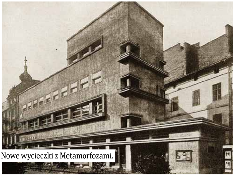
Nowe wycieczki z Metamorfozami.